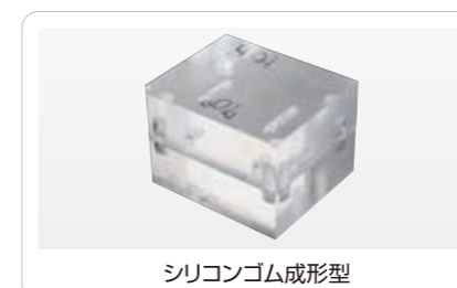
シリコンゴム成形型