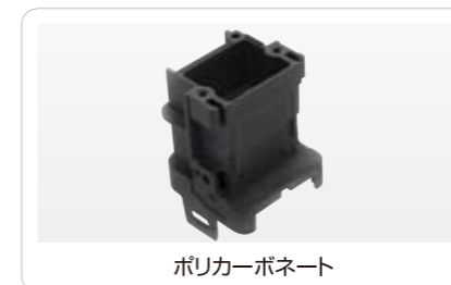
ポリカーボネート