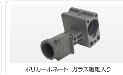
ポリカーボネート ガラス繊維入り