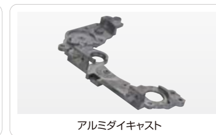
アルミダイキャスト