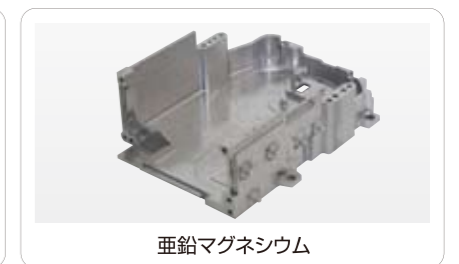
垂鉛マグネシウム