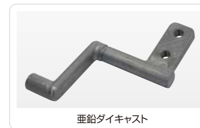
垂鉛ダイキャスト

きる。 素早くて確に何処にいても、最適な精度、価格、納期をバランスよく提案することができるシステムである。