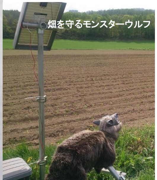
畑を守るモンスターウルフ