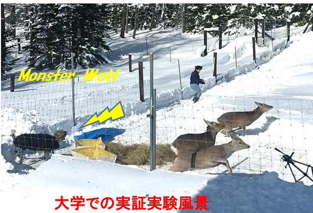
大学での実証実験風景