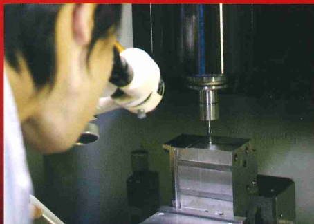
マシニングセンター