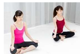
運動時の心拍・呼吸モニタ