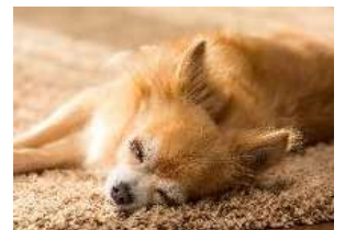
ペットの状態モニタ