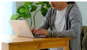
在宅ワーク者の健康管理