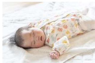
乳幼児の状態モニタ