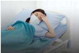
自宅療養者の容態モニタ