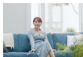
健康状態の自己管理