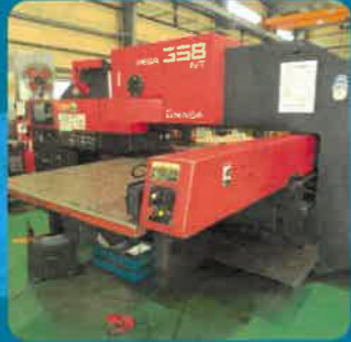
タレットパンチプレス

型式：PEGA358NT 2438 X 1219 SS 6t SUS3t AL6t