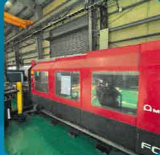
CO 2 レーザー

型式：FO3015NT 4KW 3050 X 1525 SS 19t SUS12t AL6t