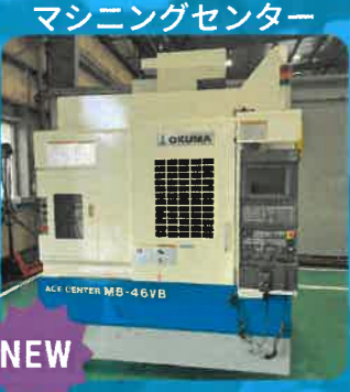
マシニングセンター