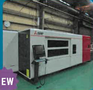
ファイバーレーザー