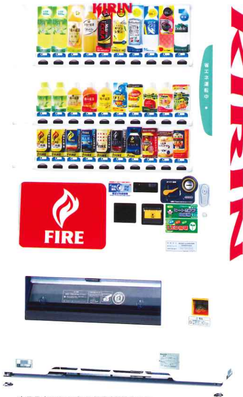
商品見本は2013年12月現在のものです。

幅999mmのスリム30セレクションタイプ。断熱材を強化・多用したことにより、従来機と比較し大幅な消費電力・消費電力量の低減を実現した【魔法VIN機】。また、地球温暖化係数が限りなく「0」に近いノンフロン冷媒(自然冷媒)を使用することで地球環境の保全に努めます。