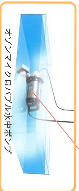
オゾンマイクロバブル水中ポンプ