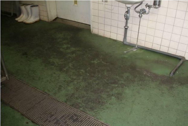
社員食堂厨房 床（簡単な工程）