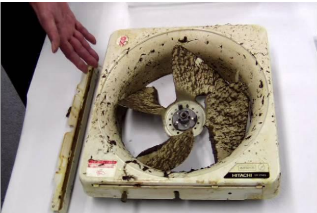
換気扇(漬置きでの効果大)