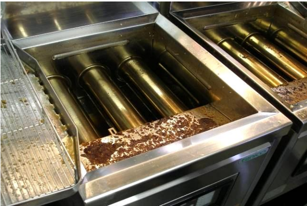
フライヤー(強力な脱脂力)

通常清掃時はバケツに10g(専用スプーン 1/3)で洗浄液を散布、デッキブラシなどで擦り軽く流水だけで終了。 泡立ちがほとんどないため、すすぎが楽に終わる