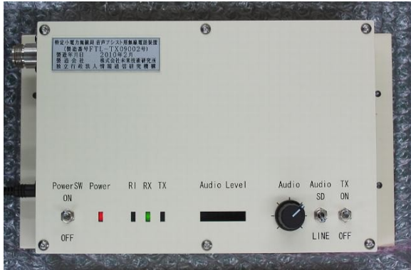
技術基準適合証明を受けた FTL製音声アシスト用無線電話装置