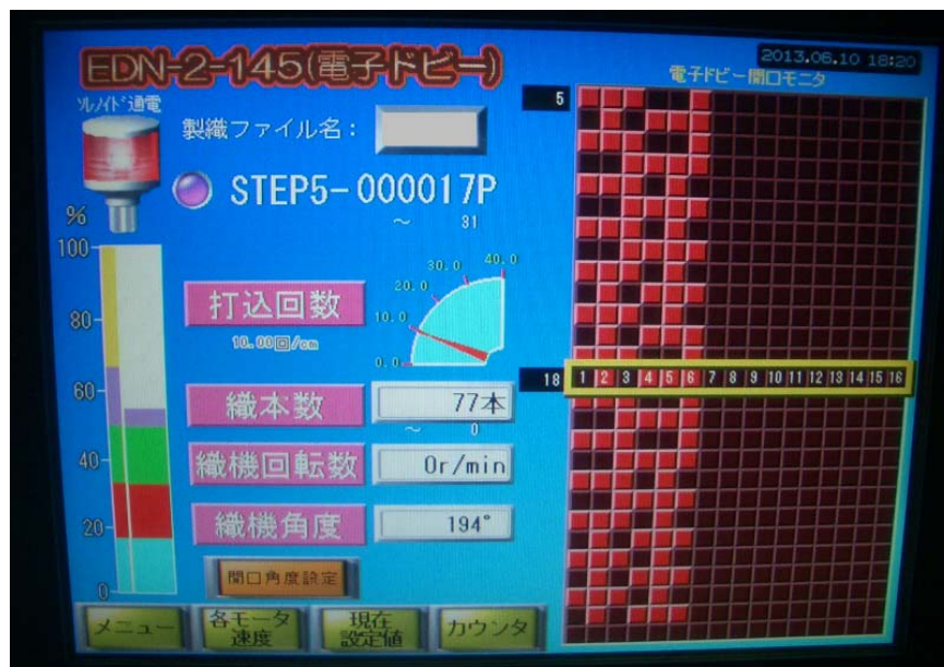
電子開口制御 設定画面