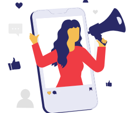
インフルエンサー