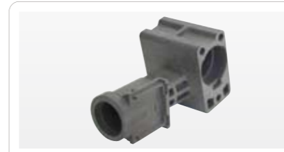
ポリカーボネート ガラス繊維入り