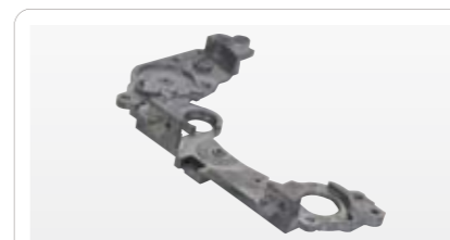
アルミダイキャスト