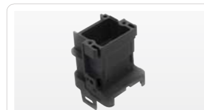
ポリカーボネート