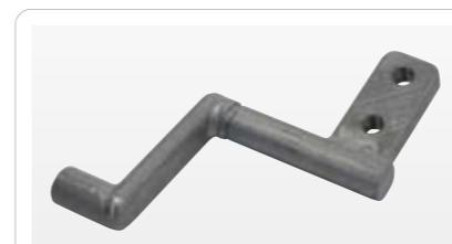
亜鉛ダイキャスト