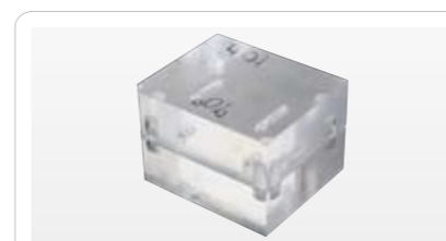
シリコンゴム成形型