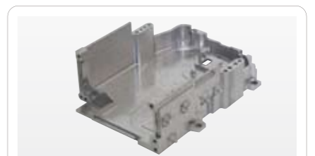
亜鉛マグネシウム