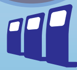
他システム (デジタルサイ ネージ, etc.)