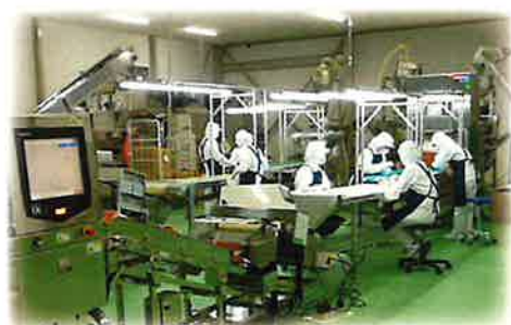
あおさのり(青ばら)選別ライン