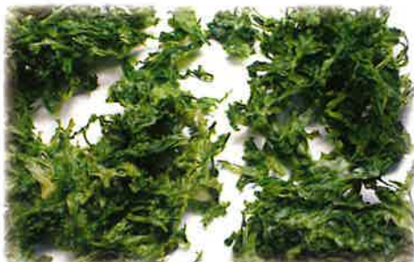
あおさのり(青ばら)原藻