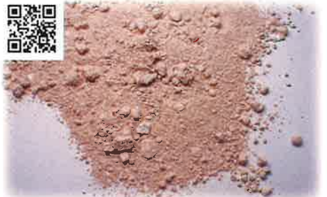
伊勢海老まるごとパウダー三重県産