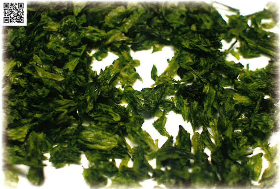
あおさのり(青ばら)15ミリ