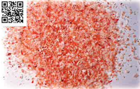
海老粉2ミリイリビ産