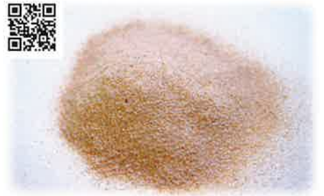
小海老(アキアミ)微粉