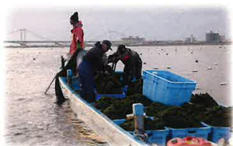
すじ青のりの収穫