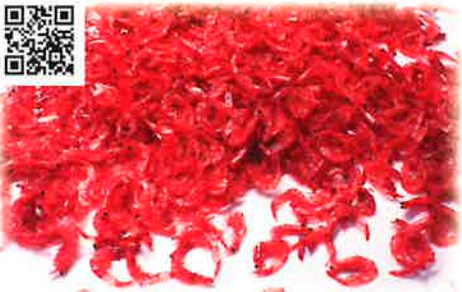
小海老(アキアミ)天着海外産