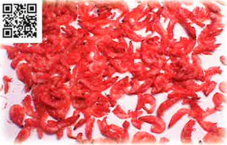
小海老(アキアミ)煮熟天着乾燥