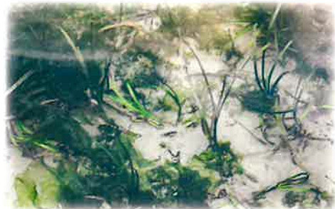
アオサの生育環境