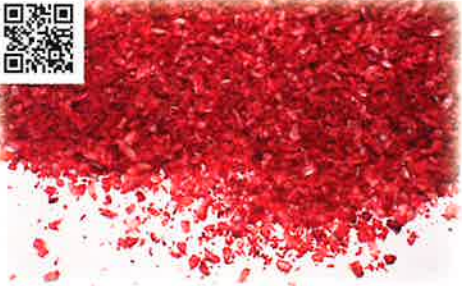
小海老(アキアミ)5ミリ天着(紅麴色素)