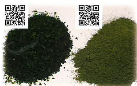
アオサ粉1ミリ、微粉