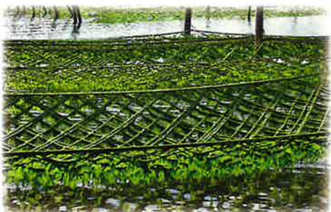
あおさのり(青ばら)養殖