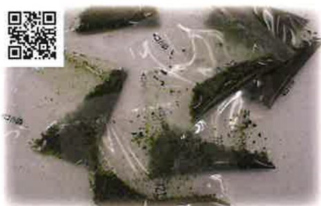
0.1~1g程度の自社小袋充填可能