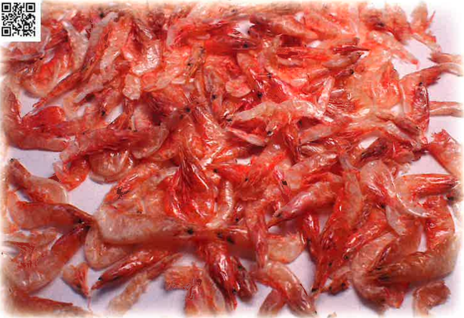
ツノエビイリビ産